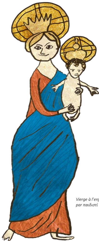
Vierge à l'enfant, par παιδιστί

3. Bénie sois-tu, Marie ; la grâce de Dieu t'a envahie. En toi le Christ est déjà sauveur. De tout péché il est vainqueur.