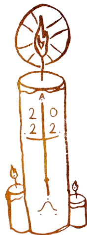
Le cierge, par Alex

4. "Comme une lampe avant le jour, J'annonce sa Lumière : Tandis que moi, je diminue, Il faut que Lui grandisse. Un cri s'élève en notre nuit : "L'Époux s'avance aux noces, ma joie est de L'entendre."