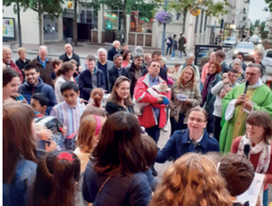
Fête de la Saint-François, bénédiction des animaux de compagnie.