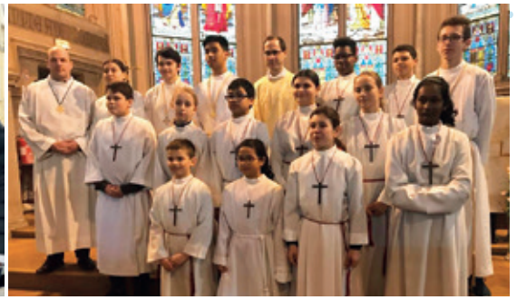
Les servants d'autel.