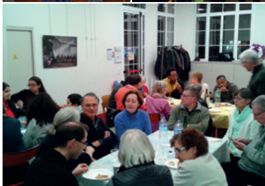
Projection du film sur le pape François. / Partage d'Évangile, à domicile. / Rencontres interreligieuses.