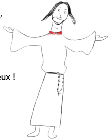
Le fils, par Nicolas

4. Si le Père vous appelle à parler de ses merveilles, A conduire son troupeau, bienheureux êtes-vous ! Si le monde vous appelle à marcher vers la lumière Pour trouver la vérité, bienheureux êtes-vous ! Si l'Église vous appelle à semer avec patience Pour que lève un blé nouveau, bienheureux êtes-vous !