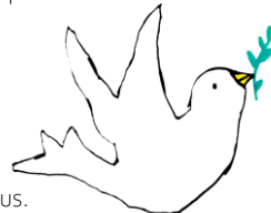
Colombe portant un brin d'olivier, par Jeanne

Agneau de Dieu qui enlèves le péché du monde, prends pitié de nous. Agneau de Dieu qui enlèves le péché du monde, prends pitié de nous. Agneau de Dieu qui enlèves le péché du monde, donne-nous la paix.