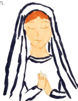
La Sainte Vierge Marie priant, par Antonia

Dans le secret du petit bout de pain tu me rejoins, Seigneur. Je le regarde, ce petit bout de pain, posé au creux de ma main. Je le regarde, et je sens bien qu'il cache un immense secret. Il cache sous son petit air de rien tout ton Amour pour moi, et l'envie que tu as de venir habiter mon cœur. Par ce petit bout de pain, dans le secret de mon cœur, Tu me rejoins, Seigneur.