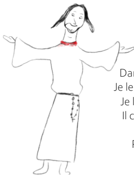
Le fils, par Nicolas

6. Ces mains qui remettent debout Qui soignent ou qui guérissent Ces mains qui sauvent et donnent vie Quand elles refont tes gestes Ces mains, quand elles partagent le pain Chantent ta gloire!