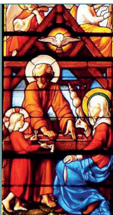
Vitrail de l'église Saint-Joseph d'Enghien.