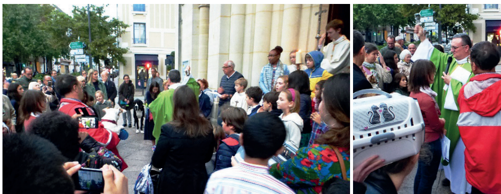
Église Saint-Joseph d'Enghien. Poissons rouges, hamsters, chats et chiens de toutes races et leurs maîtres ont cohabité dans la paix.

Le samedi 5 octobre à Enghien-les-Bains et le dimanche 6 octobre à Saint-Gratien, les animaux de compagnie et leurs maîtres ont reçu une bénédiction pour reconnaître la bonté de Dieu et les bienfaits que nous devons à la création animale.