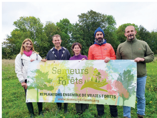
Une équipe de choc.

L'association Semeurs de Forêts a pour but de proposer une autre voie, une autre façon de voir la forêt, de découvrir un monde vivant que nous connaissons finalement si peu.