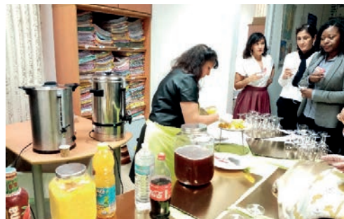
Un atelier animation cuisine.

La coordinatrice de la structure assure avec amour – et humour – une animation dynamique. Les habitants du quartier viennent pour commander bien sûr, mais aussi pour passer un moment de convivialité, sortir de l'isolement, exister. «L'amour, fait de petits gestes d'attention mutuelle, est aussi civil et politique, et il se manifeste dans toutes les actions qui essaient de construire un monde meilleur» (231).