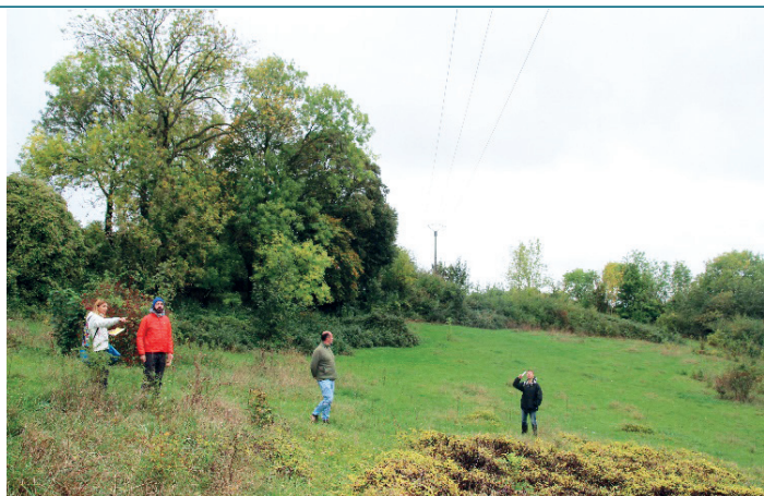
Le terrain de Juvignies.

Un premier projet : aujourd'hui, l'association vient d'acquérir son premier terrain d'1,4 hectares à Juvignies, une petite commune dans