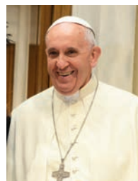
Le pape François.

Merci parce que tu es avec nous tous les jours. Soutiens-nous, nous t'en prions, dans notre lutte pour la justice, l'amour et la paix » (246).