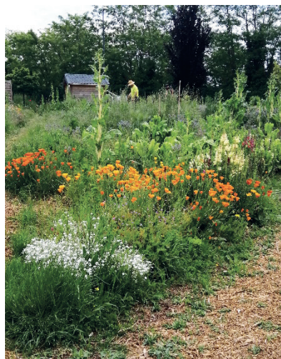
Notre jardin partagé.