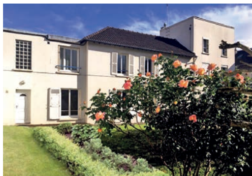
La maison des sœurs, à Enghien-les-Bains.

– nous partageons un seul véhicule et nous utilisons au maximum les transports en commun ou nous allons à pied;