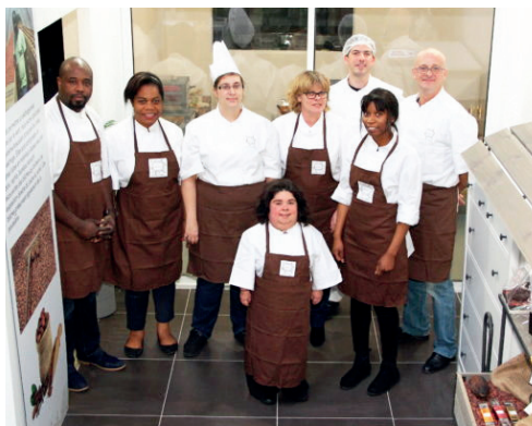
L'équipe du Février d'Or.

Février d'Or ; 10, avenue du Fief, la Mare 2, cellule 25, ZA des Béthunes 95310 Saint-Ouen-l'Aumône Tél. : 01 30 36 50 89 contact@fevierdor.com