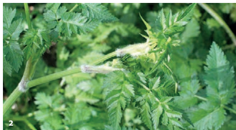
1. Ail des ours. 2. Cerfeuil des bois. 3. Nombresil de Vénus.

« Une écologie intégrale implique de consacrer un peu de temps à retrouver l'harmonie sereine avec la création » (225)