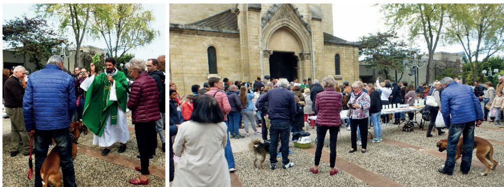
Église Saint-Gratien. La cérémonie a été suivie par un apéritif pris en commun pour faire plus ample connaissance et parler de cette joie que les animaux nous procurent.

« Les autres êtres vivants ont une valeur propre devant Dieu et, par leur simple existence, ils le bénissent et lui rendent gloire. » (69)